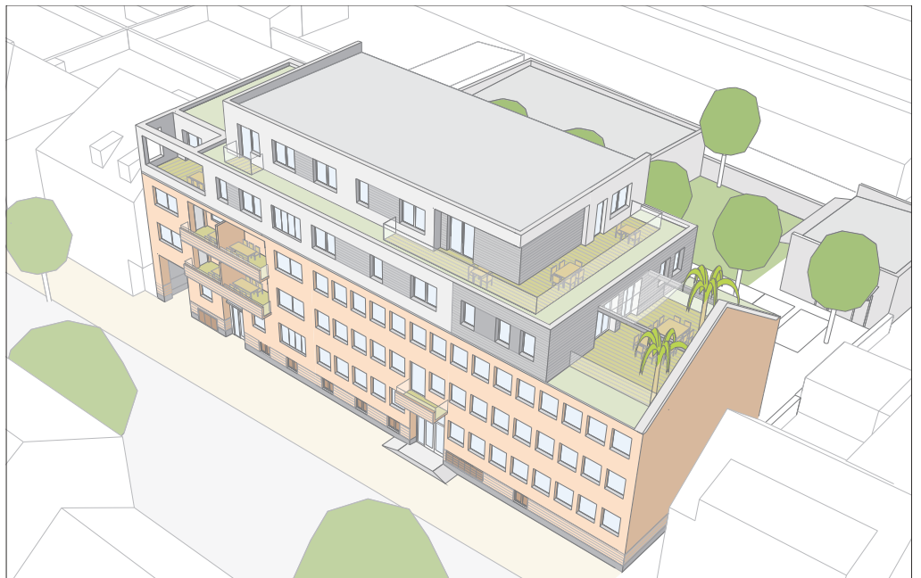
Schaubild mit Blick auf Gemeinschaftsraum und Dachterrasse im 3. Obergeschoss nach Umbau und Aufstockung